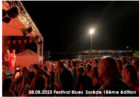
08.08.2025 Festival Blues Sorède 18ème édition