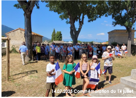
14.07.2025 Commémoration du 14 Juillet