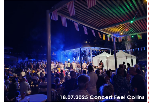
18.07.2025 Concert Feel Collins