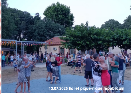
13.07.2025 Bal et pique-nique républicain