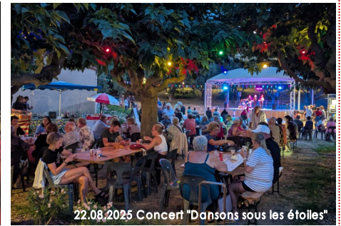
22.08.2025 Concert "Dançons sous les étoiles"

Nombreuses et variées, les festivités estivales (Bals, Concerts, Spectacle, Folklore, Marchés de terroir...) se terminent avec le Forum des Associations et l'accueil des nouveaux Sorédiens. A ne pas manquer : Halloween 26.10.2025 Cross de la St Martin 02.11.2025, Festa major 16.11.2025, Village de Noël 05-06-07.12.2025, Concert de Noël 14.12.2025