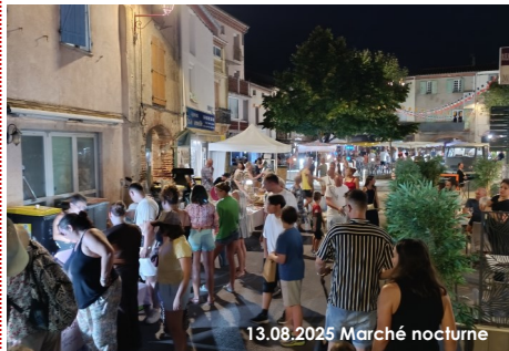
13.08.2025 Marché nocturne