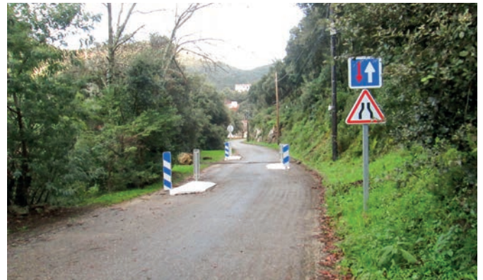
Installation de chicanes rue dels Castanyers