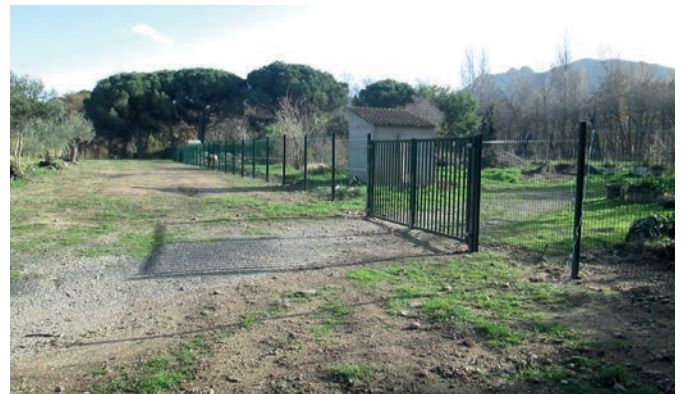
Création d'un parking avec pose de clôture à la serre municipale