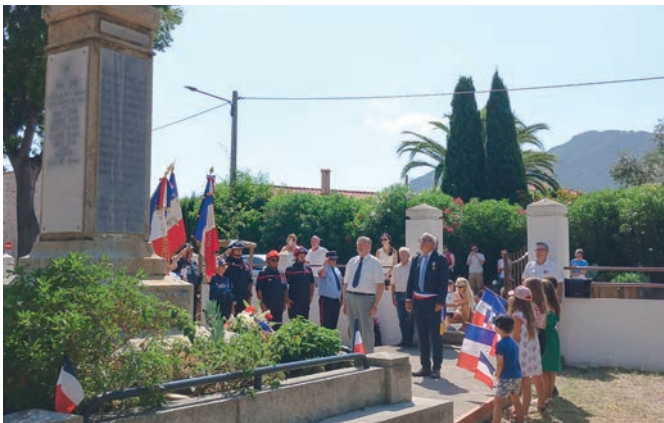
14 juillet 2025 - Commémoration au Monument aux morts