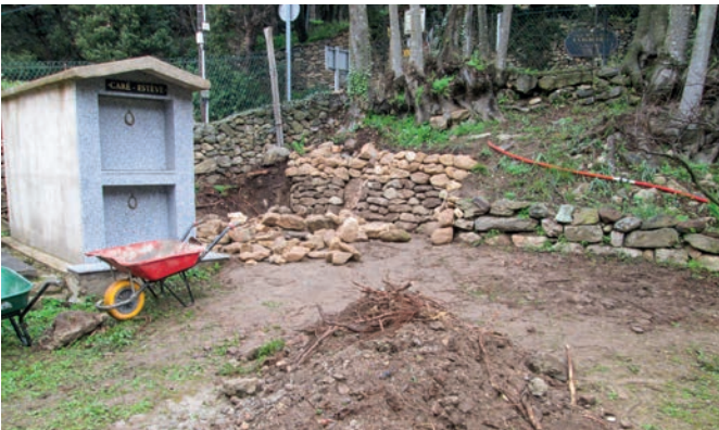
Mur de soutènement en pierre au cimetière de Lavail