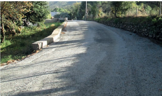
Réfection de la chaussée rue du Mas del Rost