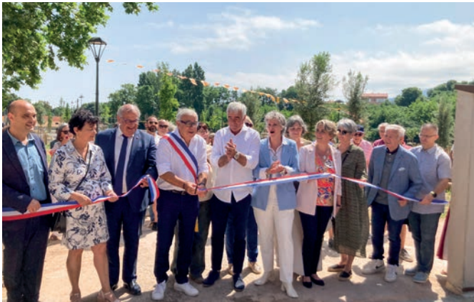
06.06.2025 - Inauguration du poumon vert