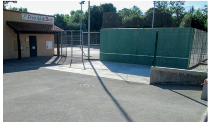
Réalisation d'une dalle devant l'entrée du Club house tennis