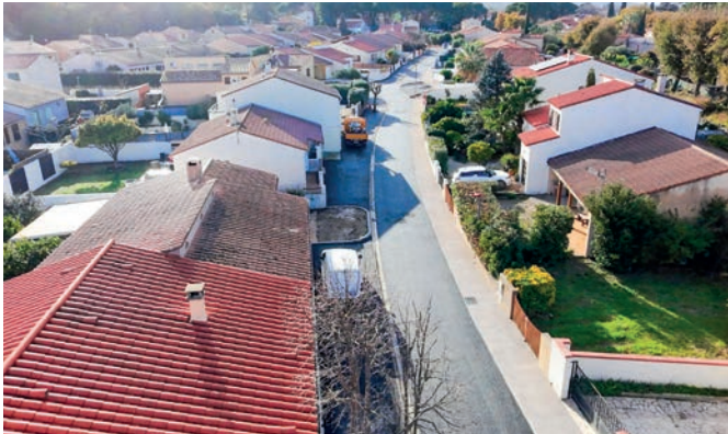
Réfection voirie et trottoirs rue de la Tagnarède