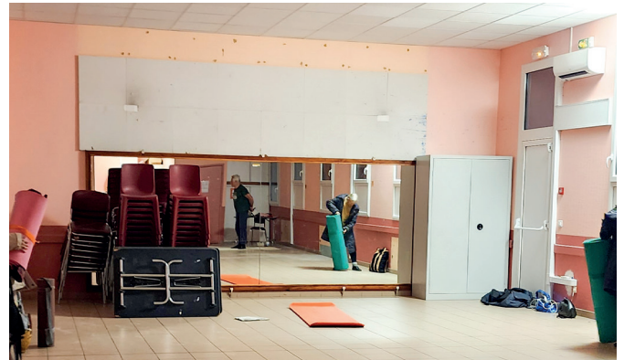
Travaux de rénovation (isolation-portes-fenêtres-climatisation réversible) salle polyvalente