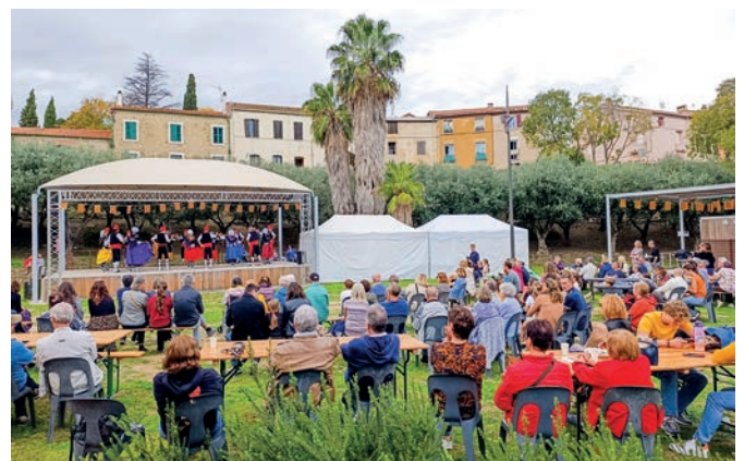
16.11.2025 - Festa major de Sureda