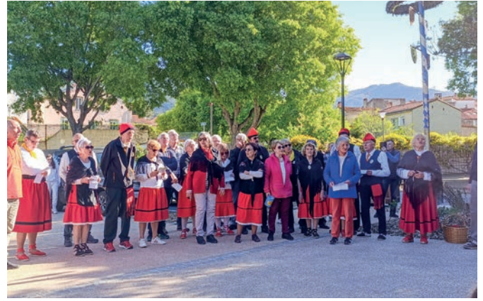
21.04.2025 - Traditionnel Goigs dels Ous 2025