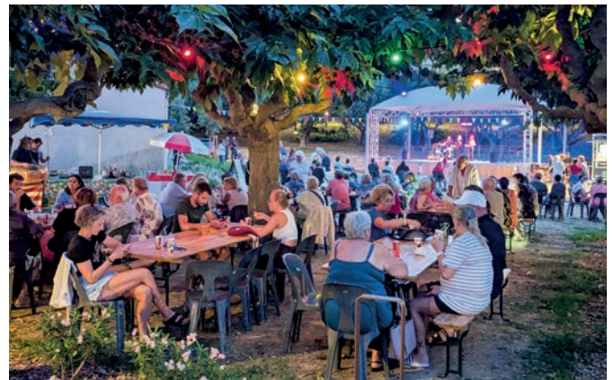
14.07.24 - Concert « Dansons sous les étoiles »