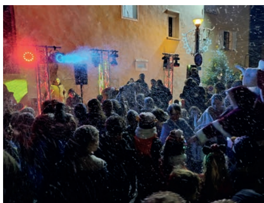
Boum du Père Noël