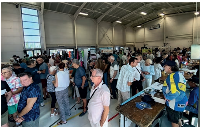
06.09.2025 - Forum des associations