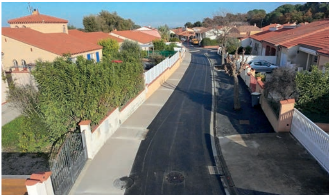
Réfection voirie et trottoirs rue de l'Aranyo