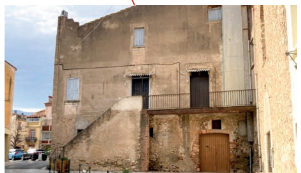
Aménagement d'un local commercial rue de l'église