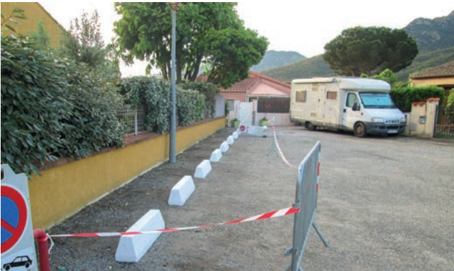
Pose de bordures impasse de la Massane