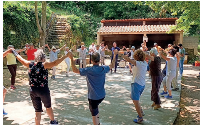
09.06.2025 - Pentecôte ND Château