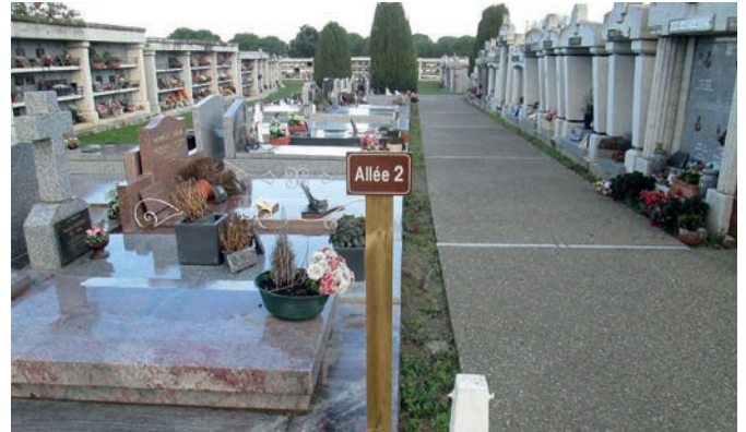
Mise en place de la signalétique au cimetière