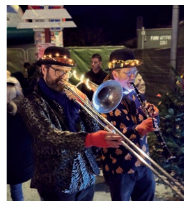
Animation de la parade

Chaque année le Centre Communal d'Action Sociale de la commune offre aux enfants du village un bâton lumineux ou une lanterne ainsi qu'un goûter à l'occasion de la « parade des lumières » suivie de la boum avec le Père Noël.