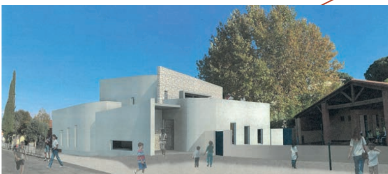
Visuel future médiathèque