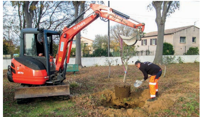
Travaux de plantations au Monument aux Morts