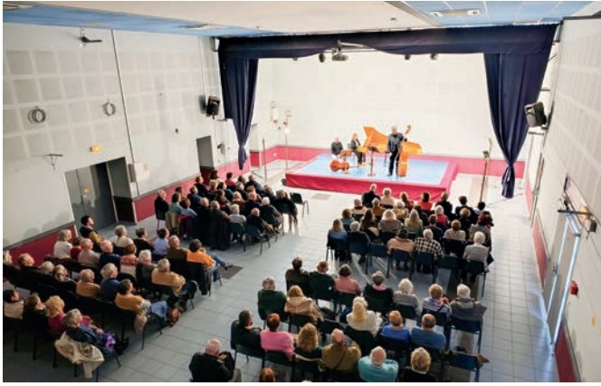
16.03.2025 - Concert Vivaldi et accueil des nouveaux arrivants