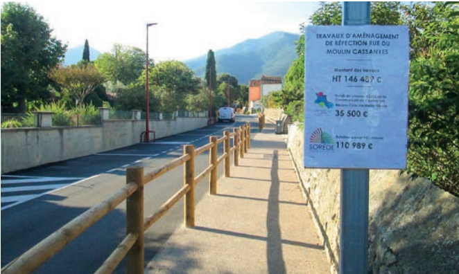
Aménagement de la rue du Moulin Cassanyes