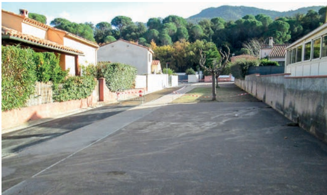
Aménagement passage entre rue de l'Aranyo et rue de la Tagnarède