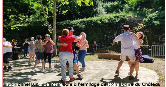
Traditionnel lundi de Pentecôte à l'ermitage de Notre Dame du Château