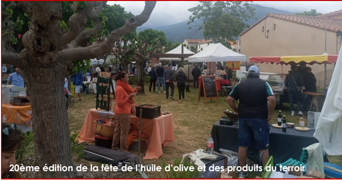
20ème édition de la fête de l'huile d'olive et des produits du terroir