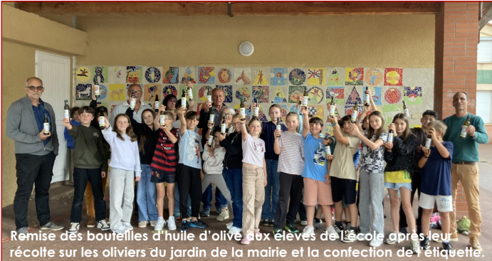
Remise des bouteilles d'huile d'olive aux élèves de l'école après leur récolte sur les oliviers du jardin de la mairie et la confection de l'étiquette.