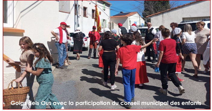
Goignels Ous avec la participation du conseil municipal des enfants